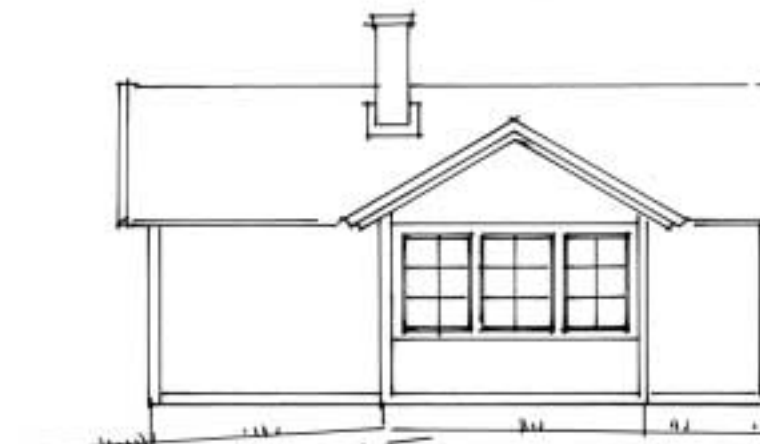
Fasad mot norr