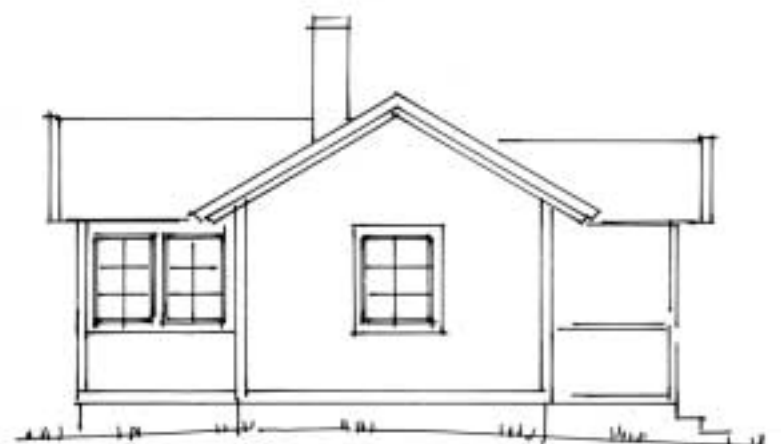
Fasad mot väster