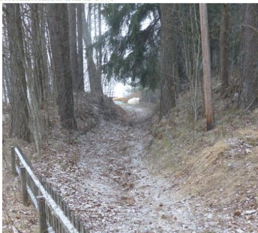
Hålvägen är en transportled från 1700-talet.

Rekommendationerna för hänsyn i planarbetet med en kommande detaljplan behöver därför kompletteras med följande.